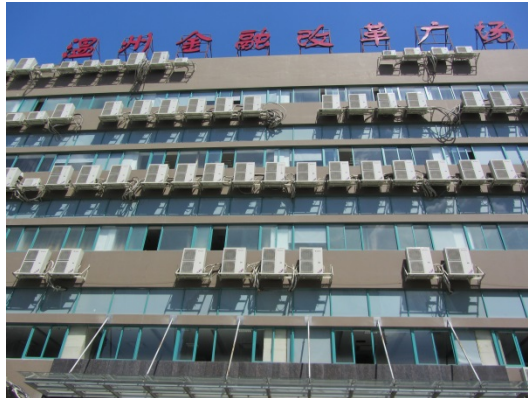
写真 4 温州金融改革広場