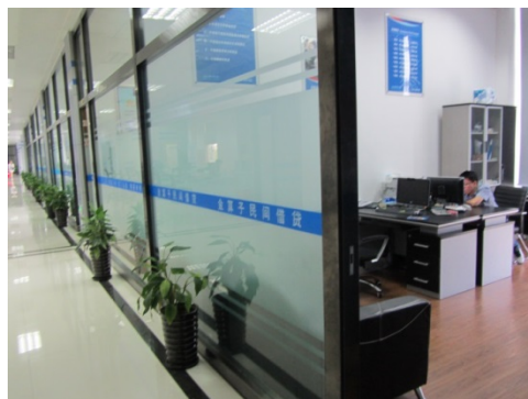
写真 3 温州民間貸借登記サービスセンターの登記等の事務サービス窓口