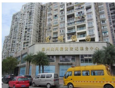
写真 1 温州民間貸借登記サービスセンター

これまで述べてきたように、登記センターは、「無管理」、「無秩序」、「無契約」が多い個人間の民間金融活動に正式な交易場所を提供しており、登記センターを活用する温州人は増えつつある。同センターで正式な契約を交わしておけば、返済の催促などもセンターを介して行うことができるからである。登記センターの担当者は次のように説明する。「民間信用危機以前、民間貸借は友人や知人同士で行われていた。そうした友人や知人との貸し借りでは、相手を信用している証として、互いの面子を保つために、書面での契約を言い出せなかった。しかし、民間貸借を仲介する正規のセンターができたおかげで、友人や知人同士も、面子が保ちながら、資金の貸し借りをすることができるようになった」。実際、友人や知人同士の民間貸借を登記センターに持ち込むケースは増えており、センターでの登記案件の約3割は、友人や知人同士の民間貸借を「表面化」させたものだとみられている。資金の貸し借りをする実の姉妹が同センターを活用したことさえあるという。驚いた事務職員が確認したところ、「仲介機関を利用しておけば、取立てのような事態になっても、互いの面子を失わずにすむから」と返答したそうだ。